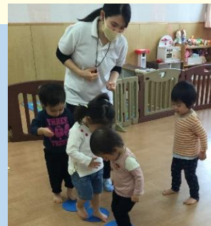
キャストプログラム