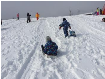
雪山でのソリ滑り