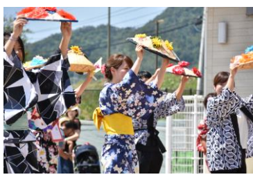
七夕まつりでの花笠