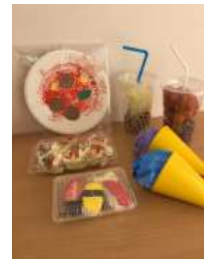
お店屋さんごっこの様子