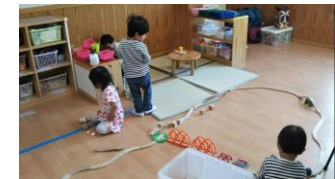
◀室内遊びの例 (3歳児)