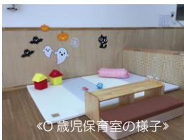
◀0歳児保育室の様子▶