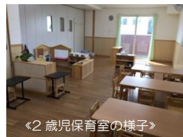
◀2歳児保育室の様子▶