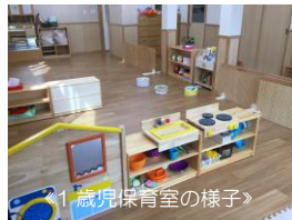
◀1歳児保育室の様子▶