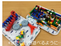
◀また明日も遊べるように...▶