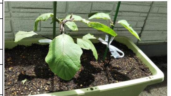
5歳児が育てている「なす」 毎年、いろいろな野菜を育てています！