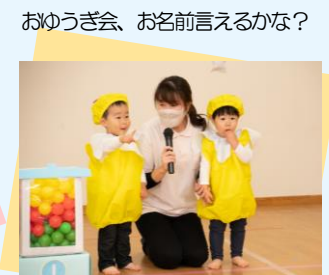
おゆうぎ会、お名前言えるかな？