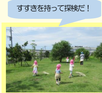
すすきを持って探検だ！