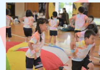
運動会、力を合わせよう！