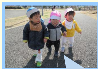
おててを繋いでお散歩楽しいな！