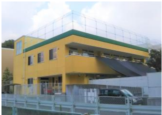
イエローの園舎が目印!