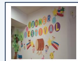
Summer festival (夏まつり)