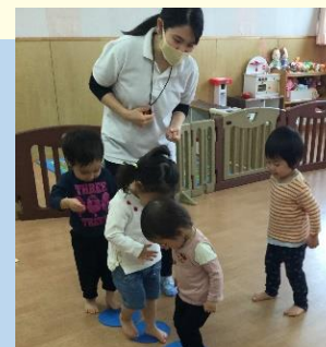
キャストプログラム