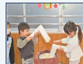
New year party