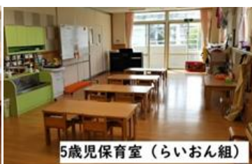
5歳児保育室 (らいおん組)