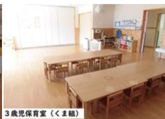
3歳児保育室 (くま組)