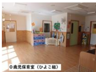
0歳児保育室 (ひよこ組)