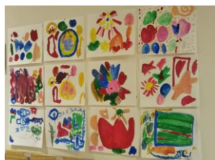
表現豊かな子どもたち♪